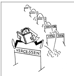
Lernen muss kein Hindernislauf sein!

Spätestens seit den Ergebnissen verschiedener Schulleistungsstudien wie PISA wurde und wird immer wieder um die Lernkompetenz der Schülerinnen